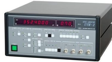
図 2. シングア라운드ユニット外観

回路上の特徴としては後述のものがあり、より精度の良いシングア라운드測定を可能にしている。